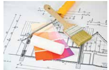
Abb. 1: Raumaufteilung, Farbgebung und das Auffinden von äußeren Störungen sind Bestandteile einer Feng-Shui-Analyse.

Zerrissenheit und die Streitigkeiten der ehemaligen Bewohner widerspiegelte. Durch Ausgleich des Grundrisses über eine einfache Gestaltungsänderung, einer energetischen Klärung und Belebung der Immobilie konnte innerhalb von sechs Wochen ein Käufer gefunden werden.