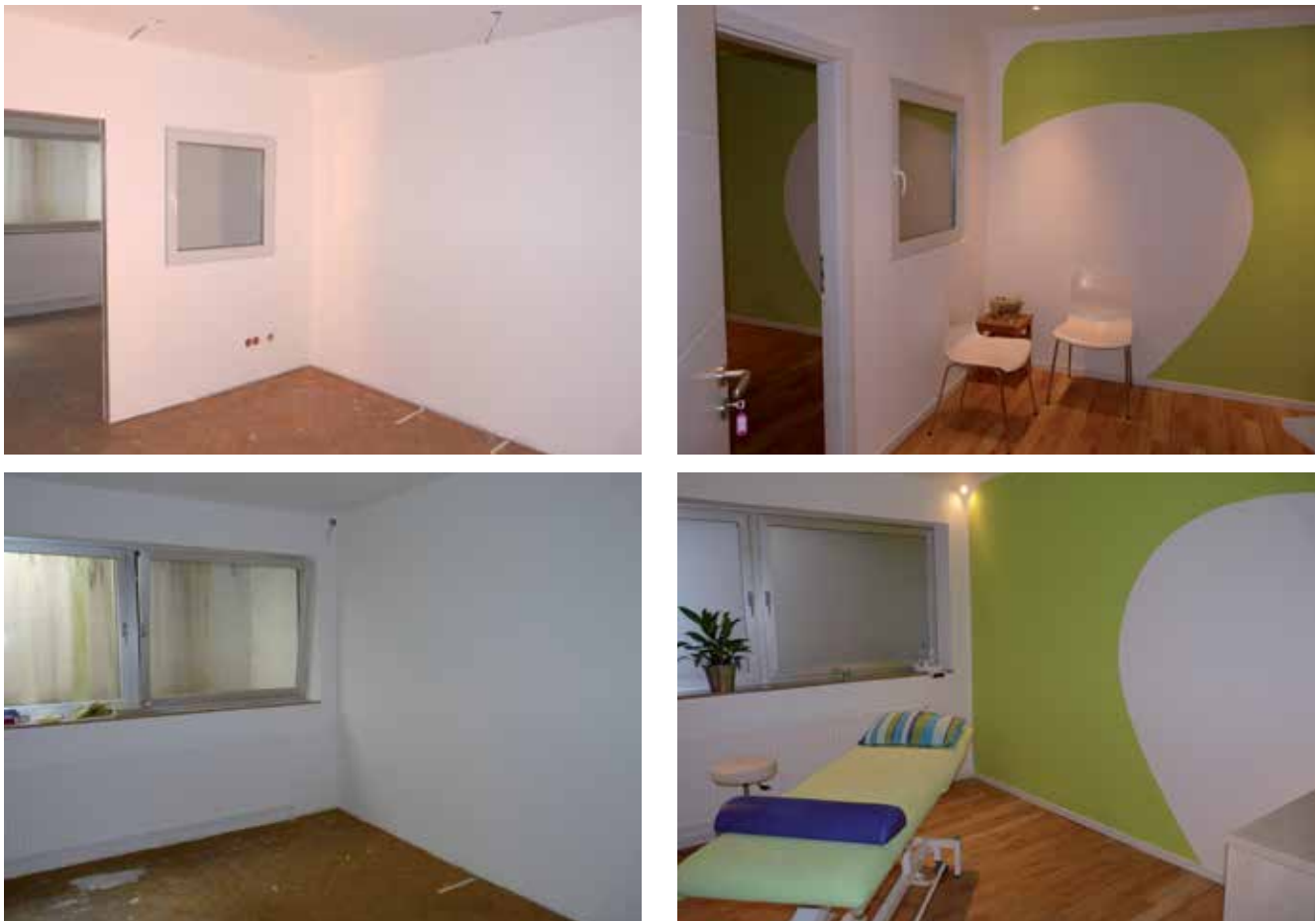
Abb. 5: Neubauten, Umbauten oder Renovierungen können ein guter Anlass sein, eine Immobilie einer Feng-Shui-Analyse zu unterziehen. In der Bilderreihe oben sehen Sie die Räumlichkeiten einer Physiotherapiepraxis (oben: Wartebereich, unten Behandlungsraum; Bilder links im Rohzustand vor dem Bezug, rechts nach fertiger Möblierung und Malerarbeiten). Die gesamte Planung wurde nach Feng-Shui-Methoden durchgeführt. Eine gezielte Gestaltung der Lichtquellen, eine harmonische Farbgebung, abgerundete Zimmerecken sowie die Auswahl von Materialien und Möbeln führen zum positiven Praxisbetrieb für Patienten und Physiotherapeuten.