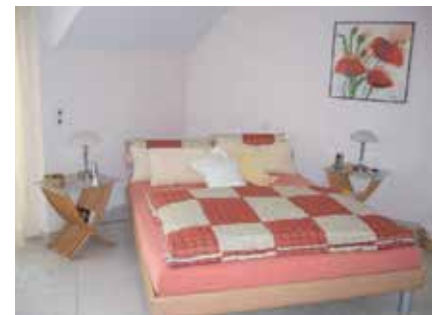
Abb. 3: Die Ausrichtung des Schlafplatzes für einen optimalen Schlaf steht im Zusammenhang mit der Ausrichtung der Nord-Süd-Achse und der Kua-Zahl. (Oben: vor der Umstellung, unten: danach)