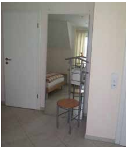
Abb. 4: Spiegel spielen im Feng Shui eine wichtige Rolle, weil man mit ihnen die Chi-Energie lenken kann – im negativen (links) wie im positiven Sinn (rechts; hier wurde der Spiegel in einen anderen Raum verlagert).

Er gab mir die Objektunterlagen und ich schaute mir die Immobilie an. Keine halbe Stunde im Objekt, passierte mir das gleiche: Ich wurde unkonzentriert und müde. Nach der Analyse stellte sich heraus, dass diese Immobilie nicht von Yin- und Yang-Energie durchdrungen wurde, sondern ein sogenannter Yang-Überhang vorhanden war. Die Besitzerin berichtete mir, dass sie unter Blutarmut und Eisenmangel leide, immer unkonzentriert und müde sei.